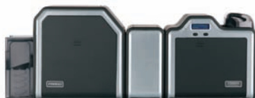
Impresora/codificadora de dos caras con opción de laminación