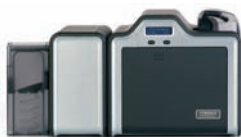
Impresora/codificadora de dos caras