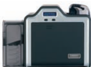
Impresora/codificadora de una sola cara

Las tarjetas de identificación deben reflejar el orgullo de su organización y el modelo HDP5000 produce tarjetas de identificación con la mejor calidad de imagen disponible. Al imprimir una imagen inversa sobre la película HDP, la cual luego es fusionada a la superficie de la tarjeta, el modelo HDP5000 crea una calidad de imagen cuyo aspecto es el una foto